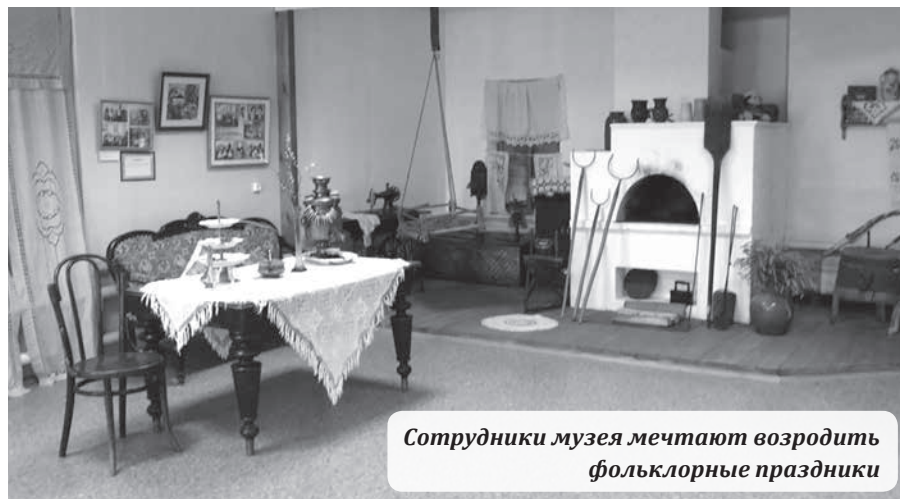
Сотрудники музея мечтают возродить фольклорные праздники