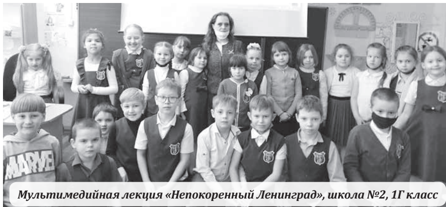
Мультимедийная лекция «Непокоренный Ленинград», школа №2, 1Г класс

Теперь находки подбрасывают прямо на крыльцо музея. А случается, что, узнав об исторической ценности, сотрудники ее выкупают. В конце 2020 года, была приобретена у местных жителей коллекция дореволюционного фарфора